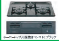
ルネコックアップ後継きコントロールブラック