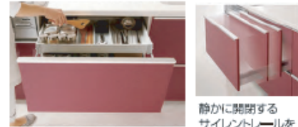
センターラインキャビネット