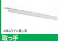
スリムラインつまみ手