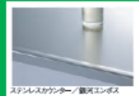
ステンレスカウンター/鏡面エンボス