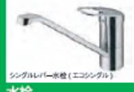
シングルレバー水栓(エコシングル)