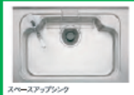
スチースアップシンク