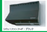
シロココファンフード: ブラック