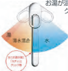
シングルレバー水栓 (エコシングルタイプ)

レバー中央部までは水 が出ます。水とお湯の境 には「カチッ」とクリック 感を設け、お湯の出始 めをお知らせします。