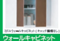
2ドアウォールキャビネット(キッチン標準仕様)